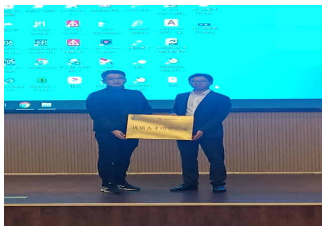
图 36 组织校企合作和企业宣讲活动