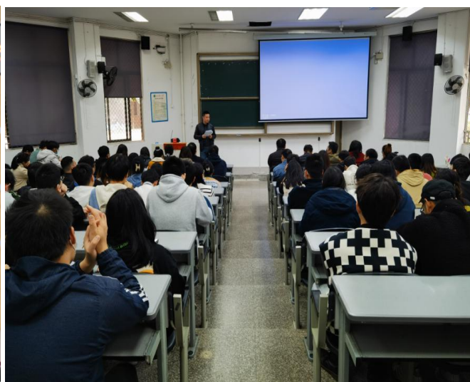
图 2 召开“大学生意识形态安全教育”主题党日活