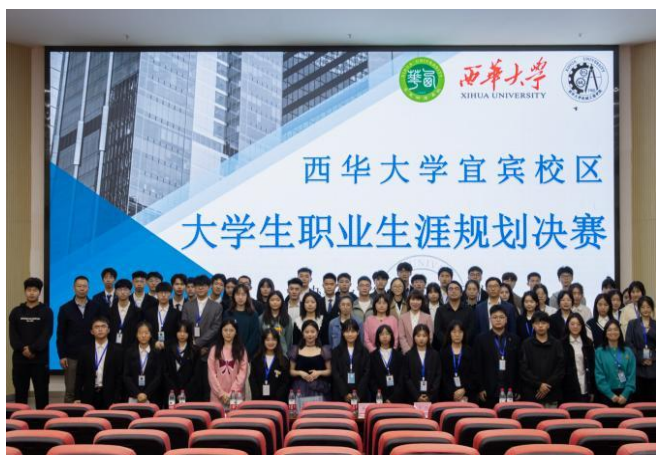
图 35 宜宾校区团总支成功举办大学生职业生涯规划大赛