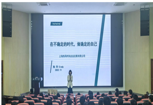
图 34 开展大学生就业指导专题讲座