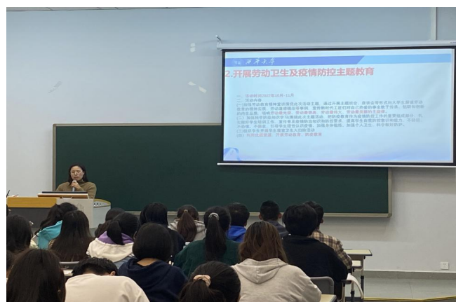
图 28 宜宾校区 20、22 级学生劳动卫生、疫情防控主题教育