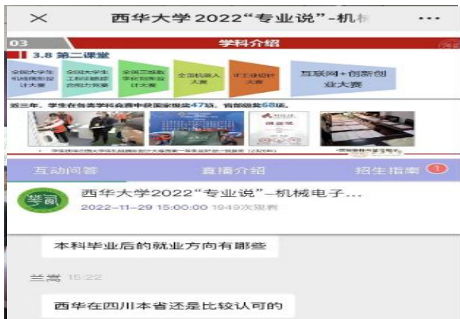
图 33 学院开展各专业线上招生宣讲工作