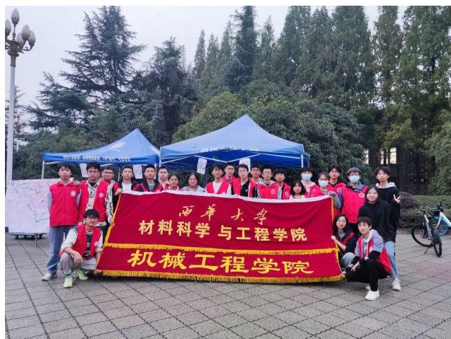
图 15 开展校园邮差活动