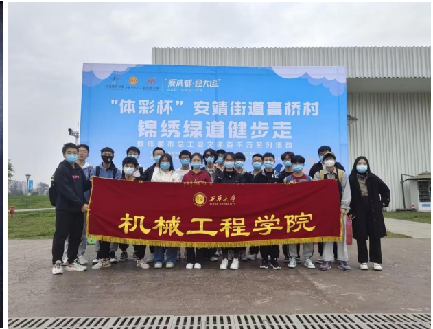
图 20 助力“爱成都，迎大运”社区运动会——健步行万里，健康我和你