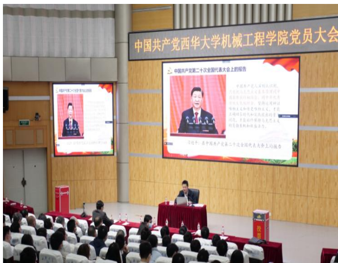
图 1 开展“让党旗在新征程上高高飘扬”主题党日活