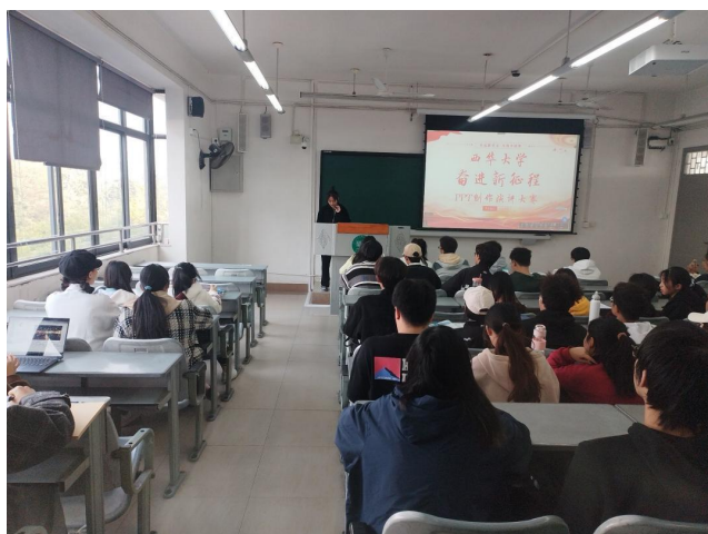
图 17 西华大学“奋进新征程”PPT 创作演讲大赛的圆满完成