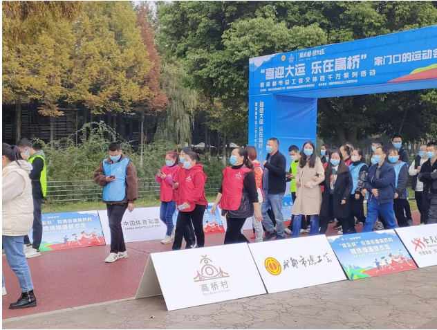
图 21 助力“爱成都，迎大运”社区运动会——健步行万里，健康我和你