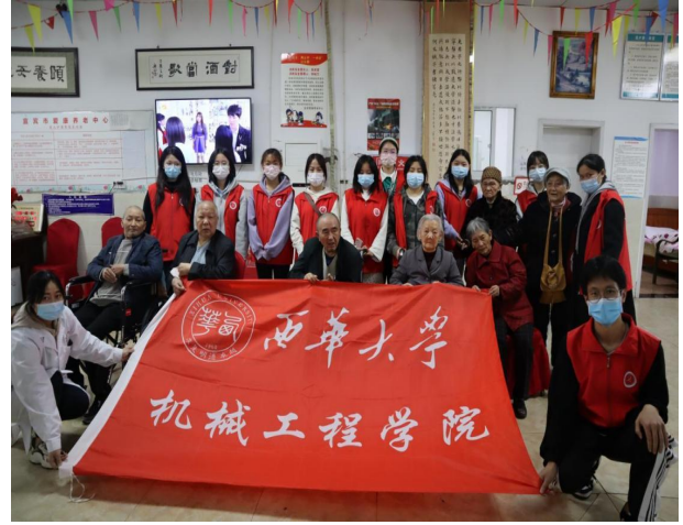
图 22 宜宾校区赴爱康养老中心开展敬老爱老志愿活动