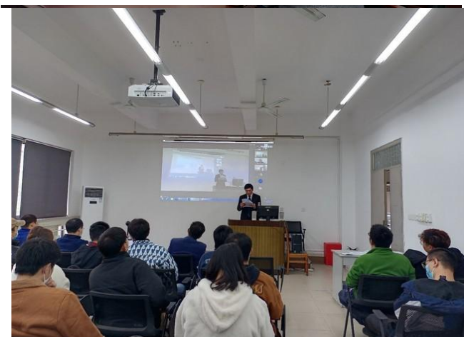
图 25 举办学院 2022 年研究生学术年会