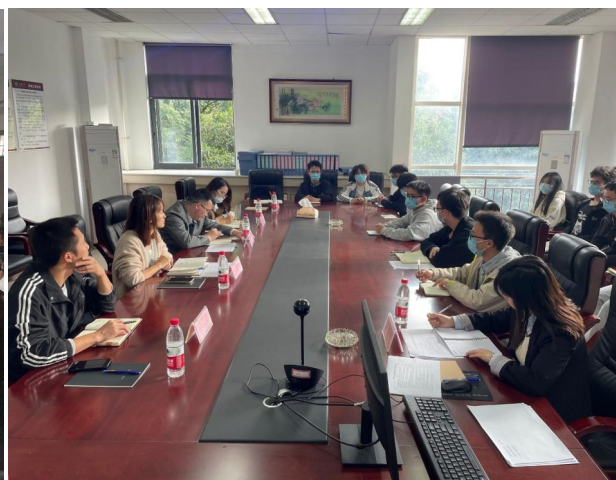
图 18 校团委莅临机械工程学院团委学生会进行调研