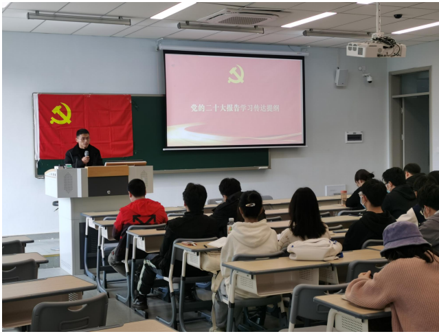
图 7 宜宾校区开展学习二十大主题活动