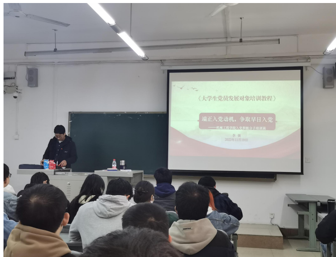
图10 2022年秋季学期入党积极分子培训班第二次党课顺利开展