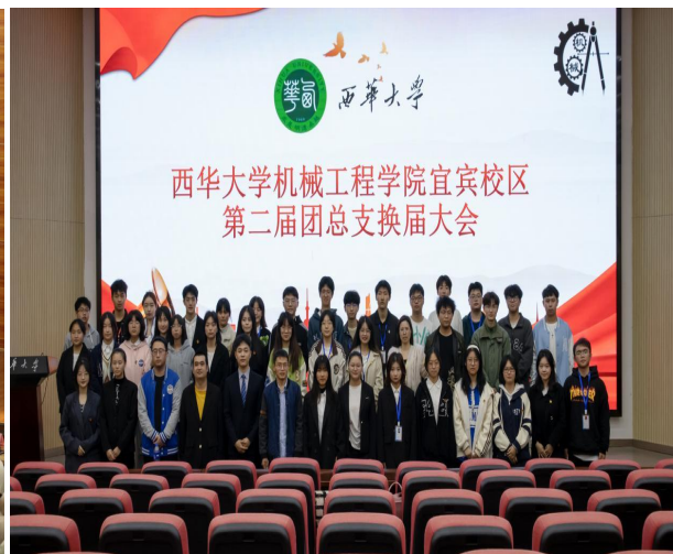
图 14 宜宾校区举行机械工程学院第二届团总支换届大会