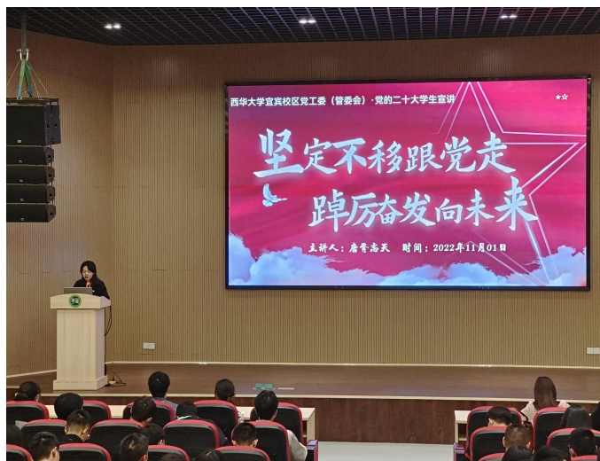
图 4 召开二十大精神宣讲活动