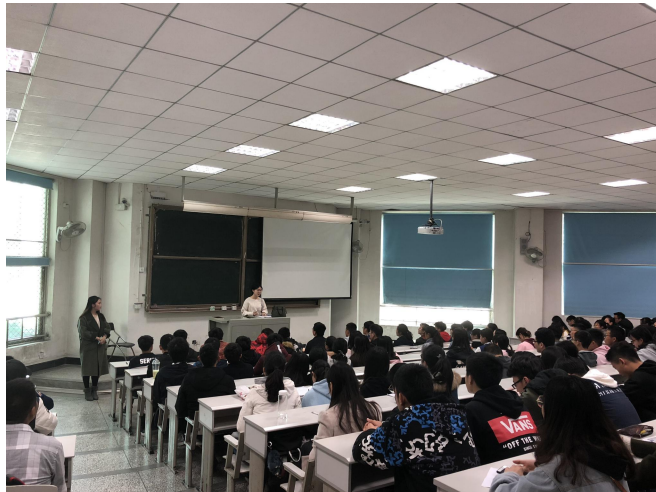
图 30 “11.9”消防知识安全宣讲活动