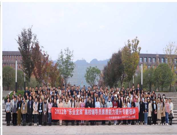
图 24 参加 2022 年“乐业宜宾”高校辅导员素质能力提升专题培训