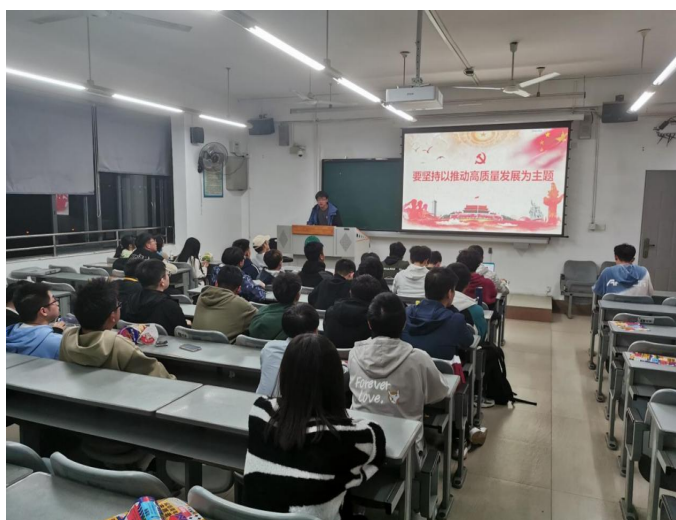
图 3 召开青马培训班