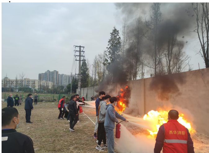
图11 秋季党校、拟发展培训班开展“消防演练”实践活动