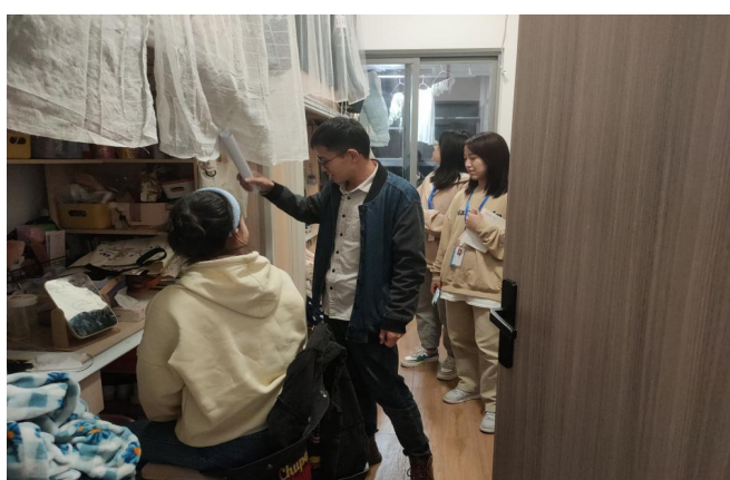
图 27 组织排查寝室安全隐患