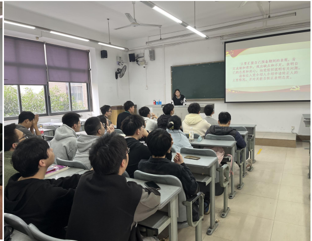
图 8 召开“弘扬伟大建党精神和延安精神”主题党日