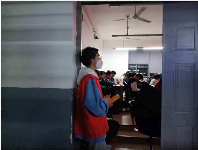
图 19 组织“西华秋韵”志愿服务活动