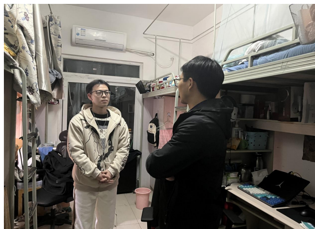
图 26 学院领导走访毕业生寝室