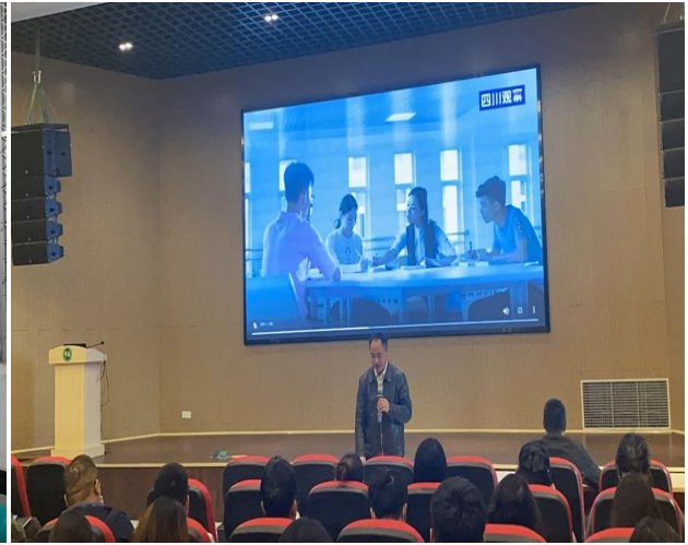
图 6 组织观看 2022 年四川省科学道德和学风建设宣讲