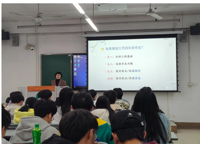
图 32 组织 2021 级农业机械化及其自动化专业班导师见面会