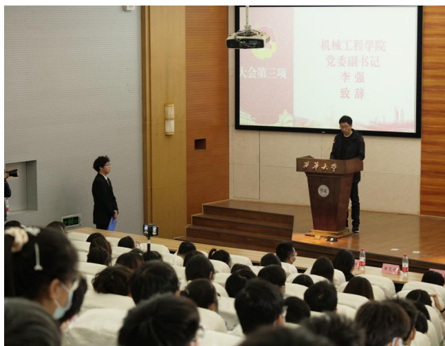
图 13 学院团委学生会换届大会圆满完成