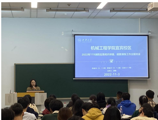
图 29 119 消防应急知识讲座暨疏散演练活动班会

为更好进行学风建设，帮助同学们了解所学专业，2022年11月25日，2021级农业机械化及其自动化专业特邀请汤晓玉老师作为主讲，为同学们答疑解惑，召开了2021级农机专业班导师见面会。21级农机专业全体在校同学及辅导员共同参加。（供稿人——朱利）