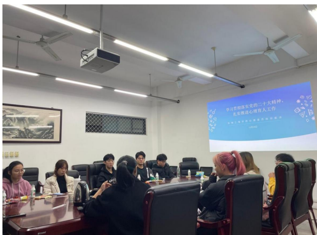
图 31 学院心理委员培训座谈会