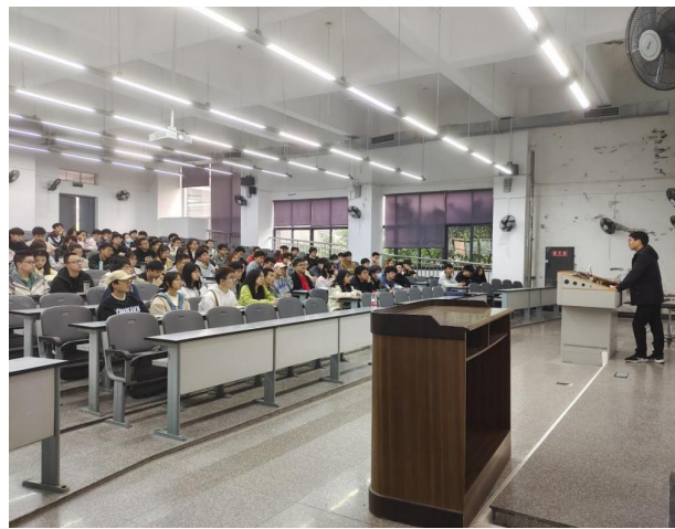
图 16 开展青年马克思主义者培训