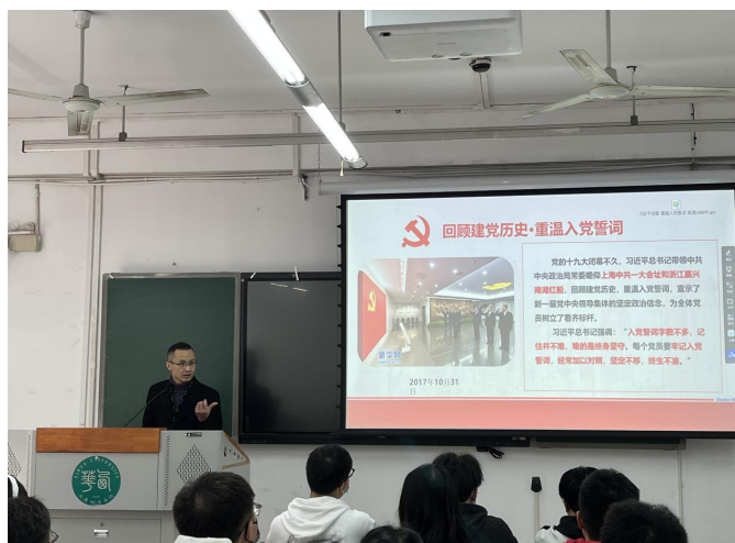
图12 百年大党入党誓词的沿革及践行——主题教育党课顺利开展