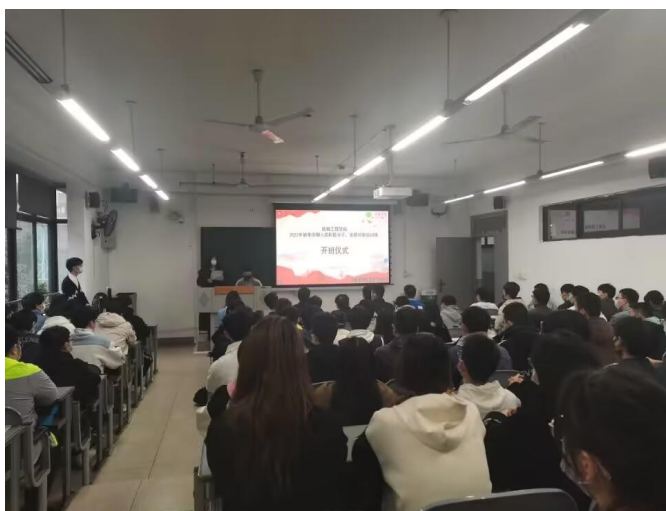
图9 举行2022年秋季学期入党积极分子、发展对象培训班开班仪式暨党课第一讲