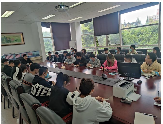
图 8 机制专业毕业生党员代表座谈会现场