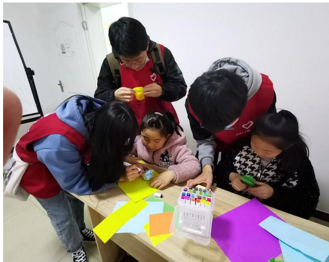
图 3 “不曾消失的温暖”纪念雷锋活动