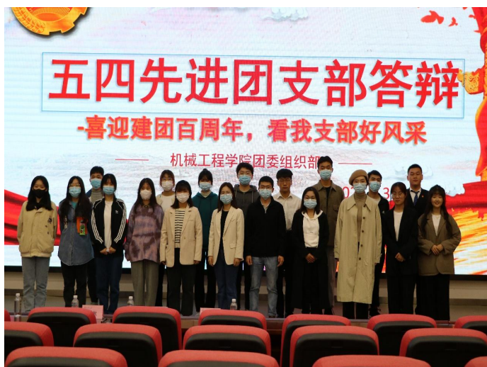
图12 “五四”先进支部答辩会现场