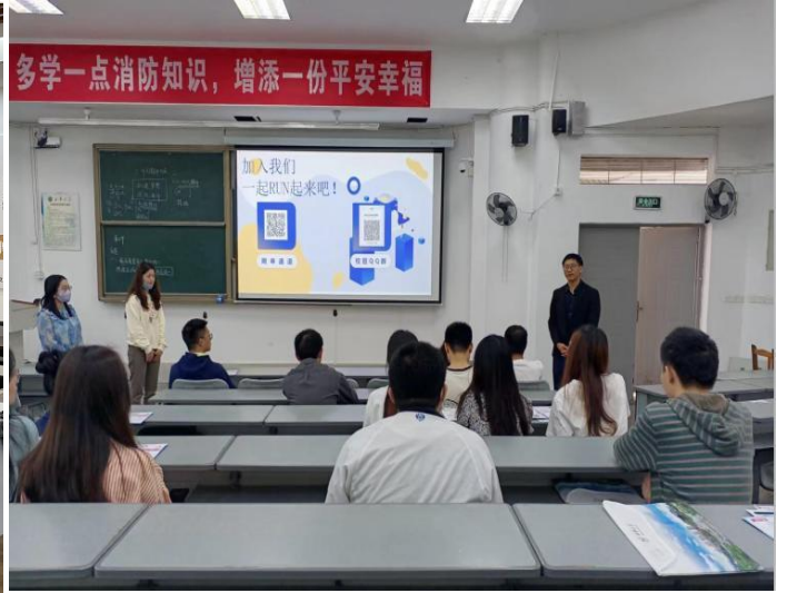
图 26 李强副书记参与川润股份招聘会