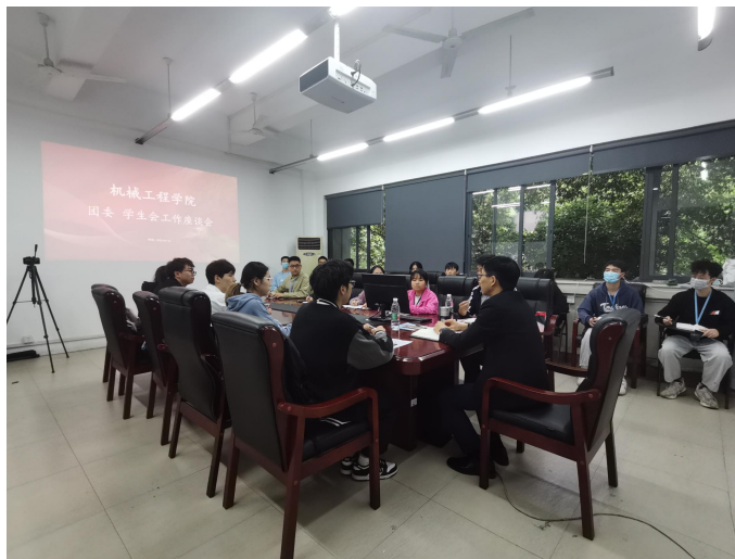
图10 团学工作座谈会现场