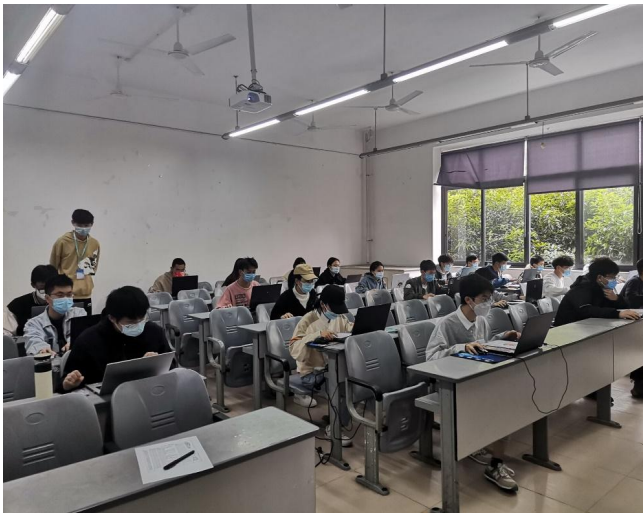
图 27 数字化三维建模大赛答题现场