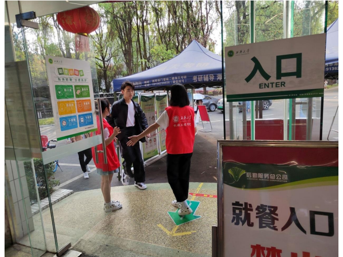
图 14 第二次食堂防疫系列志愿服务活动