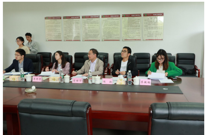
图 30 “校友杯”学院初赛现场 2