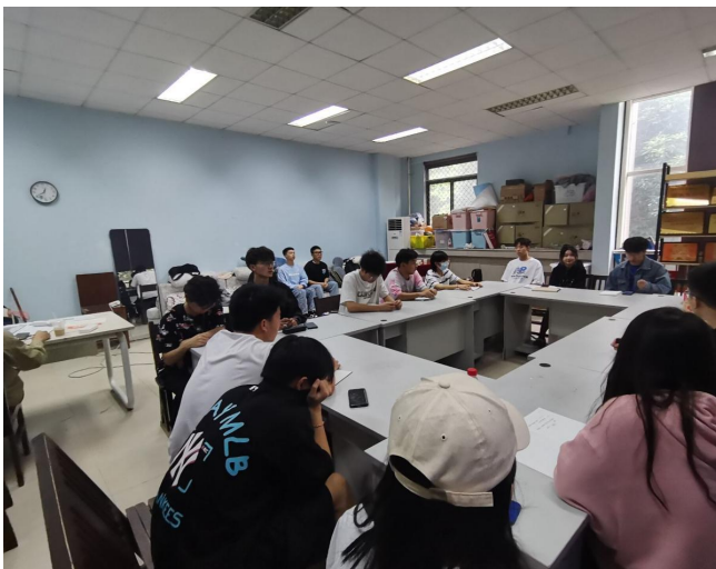
图 17 大学生骨干培训文体委员工作会议