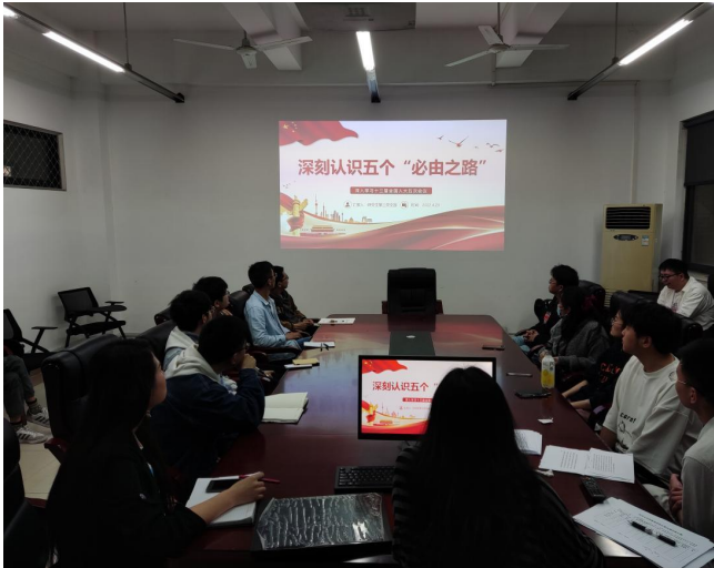
图 1 全国“两会”精神专题学习会现场