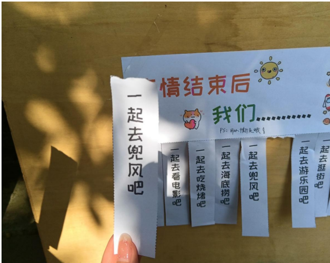
图 13 “疫情防控，传递温暖”活动