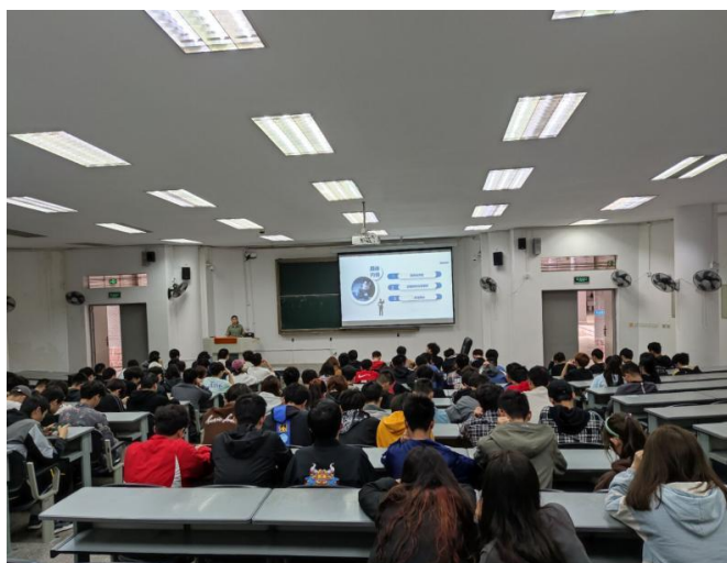
图 18 学业指导班会现场