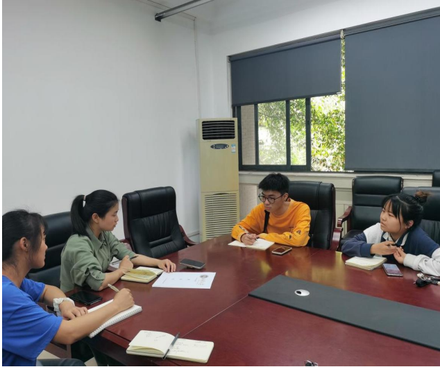
图 23 心理工作推进会现场