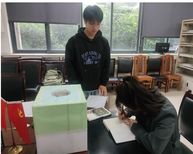
图 19 “以书换书”活动现场