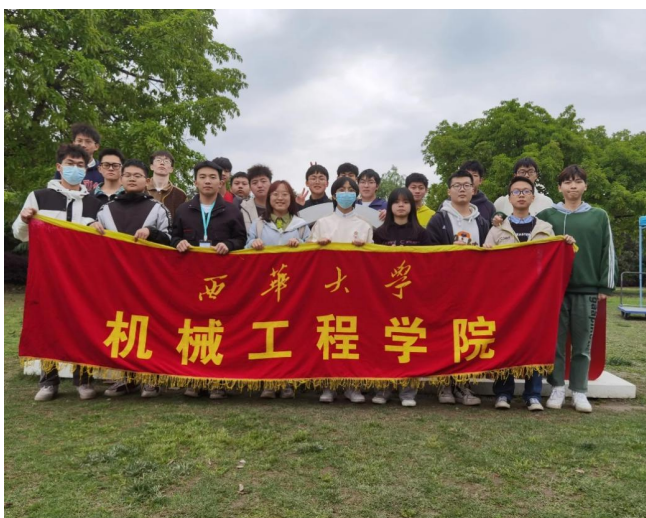
图11 回顾历史，学习党团精神主题活动