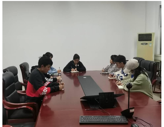
图 24 第二次心理工作研讨会现场