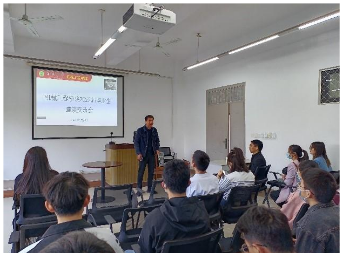
图 28 2022 届毕业生座谈交流会现场