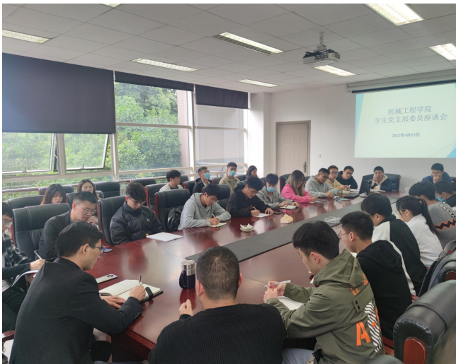
图 7 学生党支部委员党员代表座谈会现场