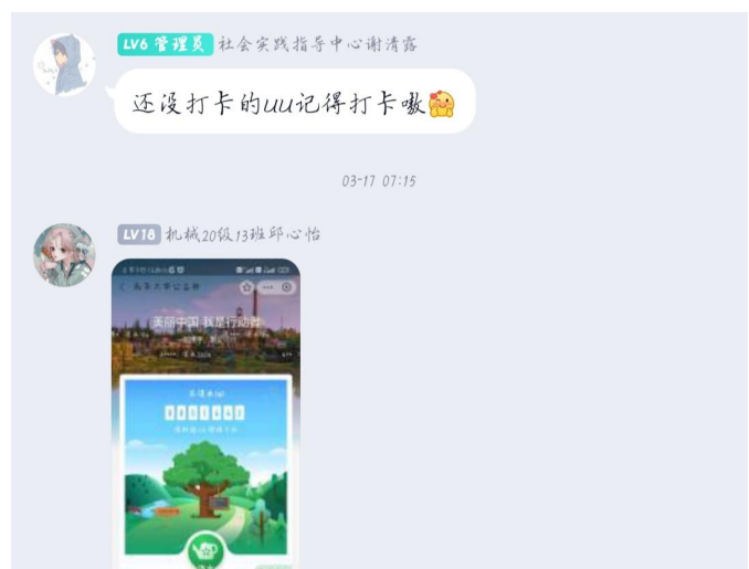
图 16 3.12 线上植树活动