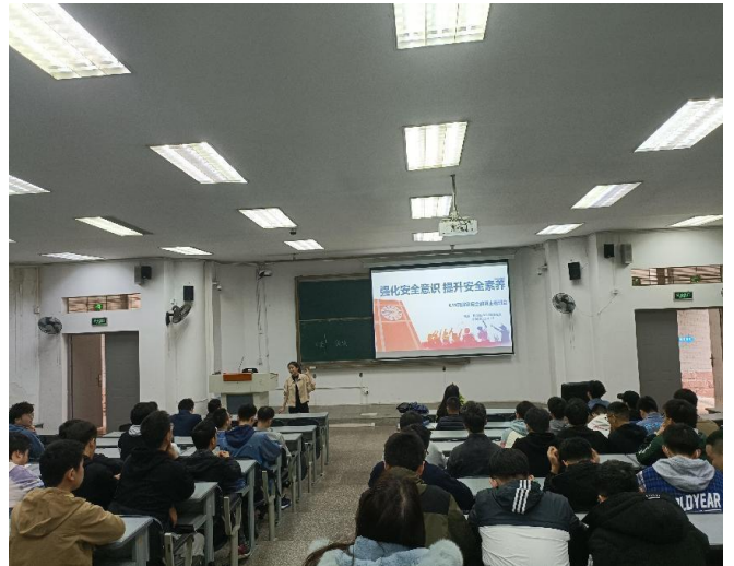
图 22 安全教育主题活动现场