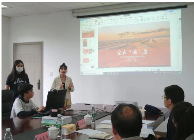
图 29 “校友杯”学院初赛现场 1