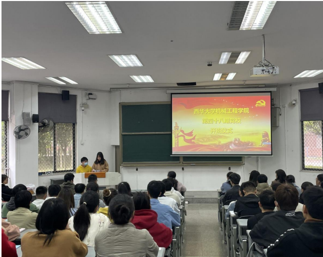
图 5 第 48 期党校培训开班典礼现场