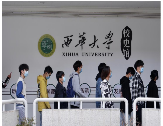
图 6 入党积极分子参观校史馆现场