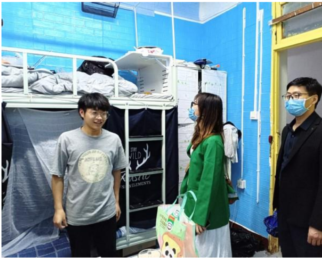
图 21 李强副书记组织走访学生宿舍