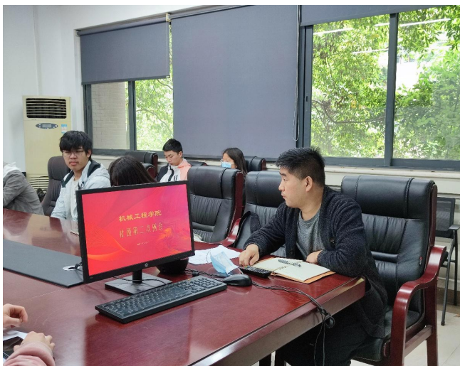
图9 社团工作交流分享会现场

为充分表彰机械工程学院先进支部，为学院树立先进典型，进一步推动“五四”评优工作开展，学院于2022年3月31号下午分别在西华大学校本部5A205和西华大学宜宾校区1教101举行先进团支部答辩会。最后共有9个团支部以其扎实的基层团支部建设，浓厚的学习氛围，斗志昂扬的班级风貌赢得了在场评委老师和同学们的肯定。此次答辩会激发了全院各支部的活力，夯实了基层建设工作，增强了支部凝聚力，为推动学院基层发展奠定了坚实基础。