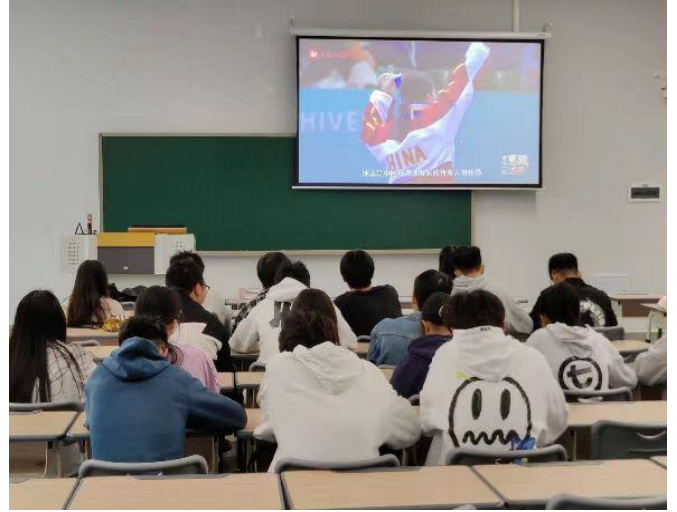
图 2 "同上一堂'冰雪'思政大课"现场