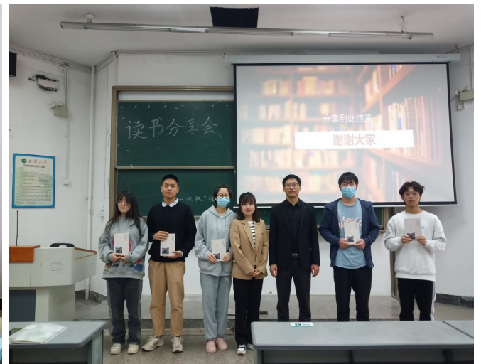
图 4 “百年风雨映书香”读书分享会现场