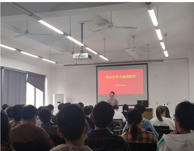
图 20 毕业生诚信教育活动现场